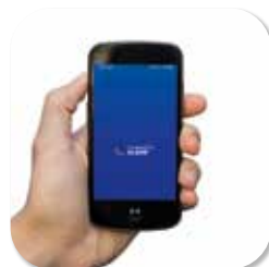
ALARMSYSTEM DSC NEO APP STEUERUNG