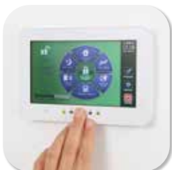
ALARMSYSTEM DSC NEO TOUCHBEDIENTEIL