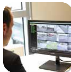
IP VIDEO MANAGEMENT