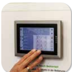
ALARMSYSTEM TELENOT BEDIENTEIL