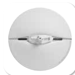
ALARMSYSTEM DSC NEO RAUCHMELDER