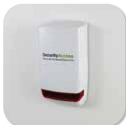
ALARMSYSTEM DSC NEO AUSSENSIRENE