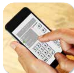
ALARMSYSTEM TELENOT APP STEUERUNG