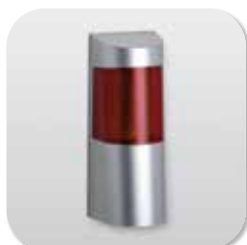
ALARMSYSTEM TELENOT AUSSENSIRENE