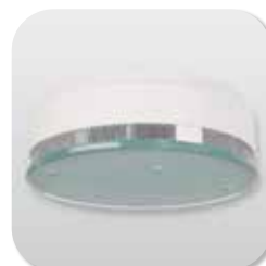
ALARMSYSTEM TELENOT RAUCHMELDER